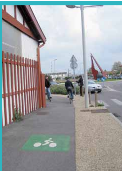
Ça se gâte très vite.- Avenue de l'Adour, le slalom entre les maisons commence et certains angles droits présentent de réels dangers de collisions. Ce ne sont pas ces deux cyclistes qui vous diront le contraire !