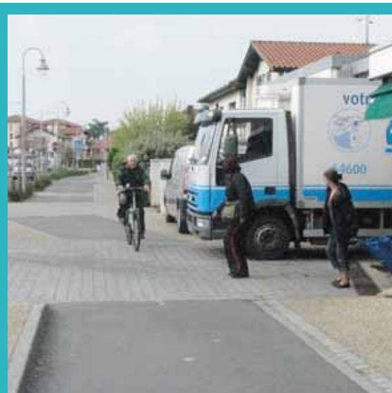
Danger omniprésent !- Dans cette zone de commerces, entre les camions de livraison, les automobilistes qui déboitent brutalement quand ils aperçoivent une place de parking, les clientes qui papotent en sortant des magasins et les intersections, le malheureux cycliste ne sait plus où donner de la tête pour tenter de rester en vie. Et si le cyclo s'amuse à aller sur la chaussée, comme le Code de la route l'y autorise, ce sont les automobilistes qui l'insultent !