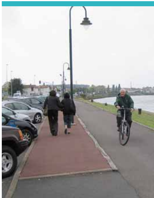
Au départ, tout va bien.- Voitures au centre, piétons sur un trottoir spécifique, vélo sur une chaussée aménagée, le début de la promenade sur les bords de l'Adour est parfaitement conçu.

Anglet offre la particularité d'avoir une façade maritime mais aussi une façade fluviale puisque l'Adour se jette dans l'océan à cet endroit. Bien entendu, cet axe, composé de l'avenue des Allées marines, de l'avenue de l'Adour et du boulevard des Plages, est très fréquenté par les promeneurs, en particulier l'été, puisque toutes les villes de la Côte basque voient leur population multipliée par dix. Au départ, une simple bande peinte permettait aux cyclistes de déambuler dans leur couloir tandis que les voitures circulaient dans leur et que les vacanciers, encombrés par leurs planches de surf envahissaient les trottoirs. Et tout semblait aller pour le mieux dans le meilleur des mondes cyclistes !